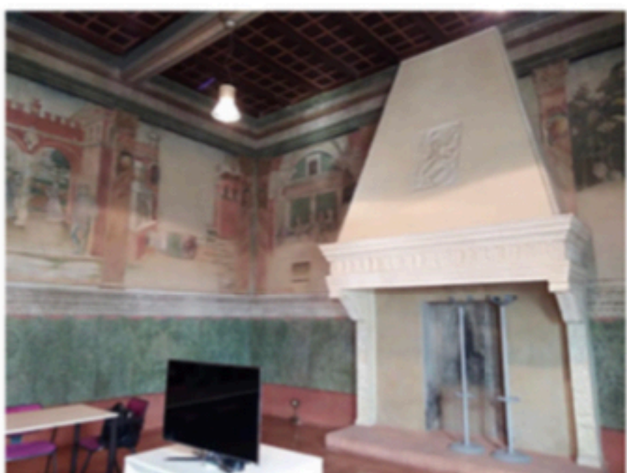
Sala del pane