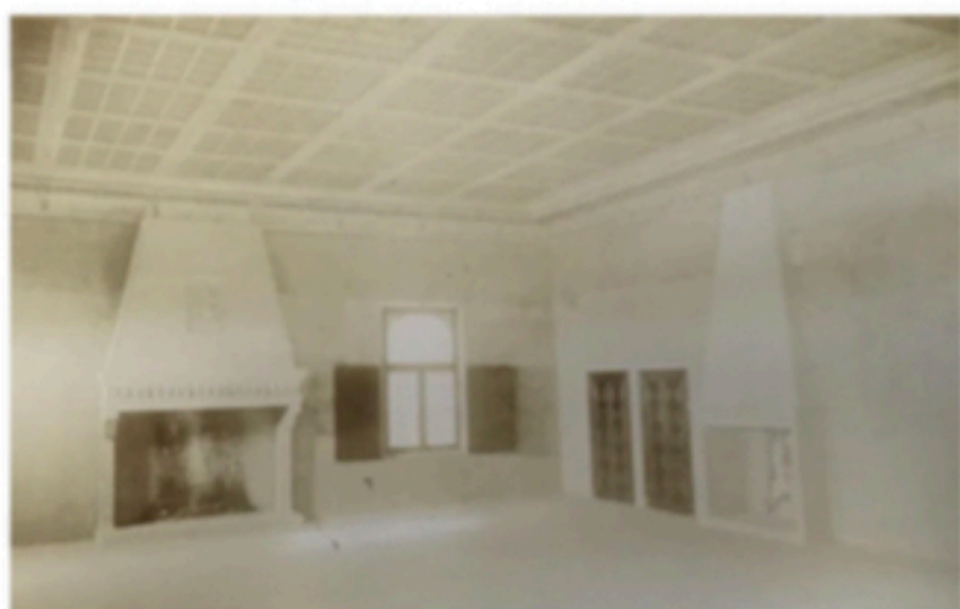
Sala dei cinque camini