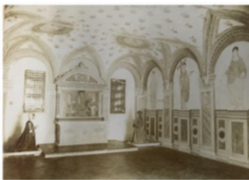
Positivo del Fondo Antico IsArt catalogato con NCTN F000607