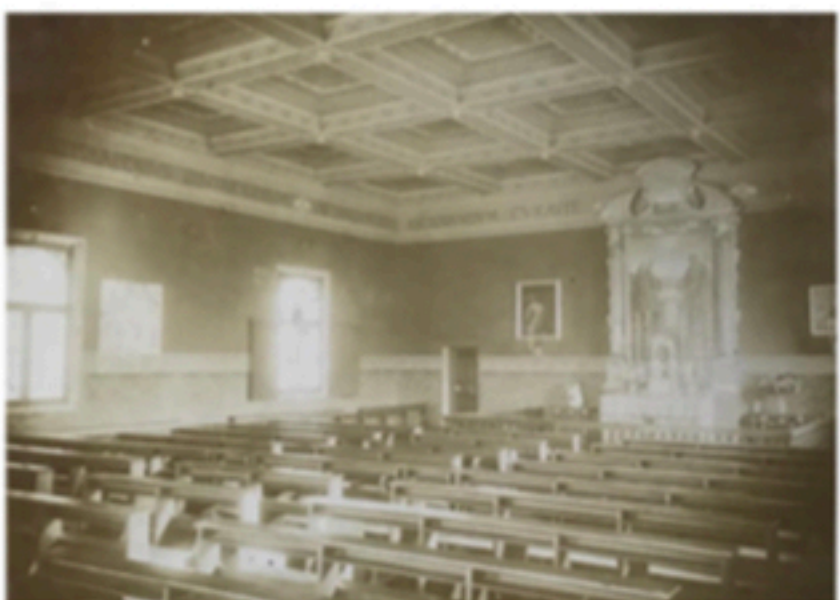
Positivo del Fondo Antico IsArt catalogato con NCTN F000609

Cappella al piano nobile del Castello, progettata da A. Rubbiani agli inizi del XX secolo, unificando due sale di epoca rinascimentale. Il marchese C.A. Pizzardi ha fatto realizzare questa ampia cappella perché potesse accogliere tutti gli abitanti di Bentivoglio (vedi A.Rubbiani, Il Castello di Giovanni II Bentivoglio a Ponte Poledrano , Zanichelli 1914 ristampa 1989, pp.57-58)