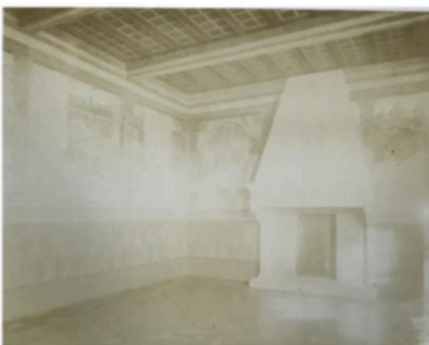
Positivo del Fondo Antico IsArt catalogato con NCTN F000601